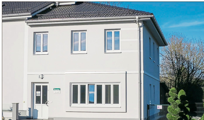
Das neue Bürogebäude