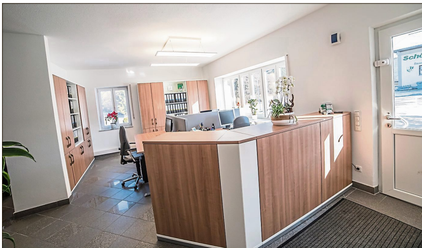
Bei der Planung wurde viel Wert gelegt auf helle, freundliche Büroräume.